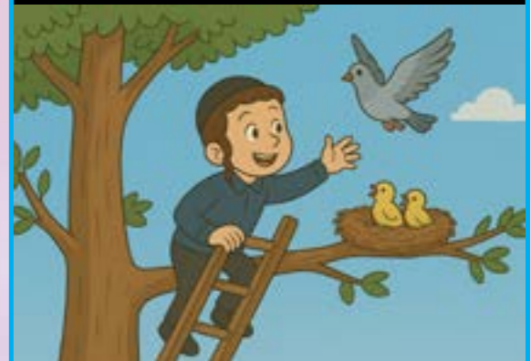
עצות שילוח הקן מייצגת רק במקום הפקר.