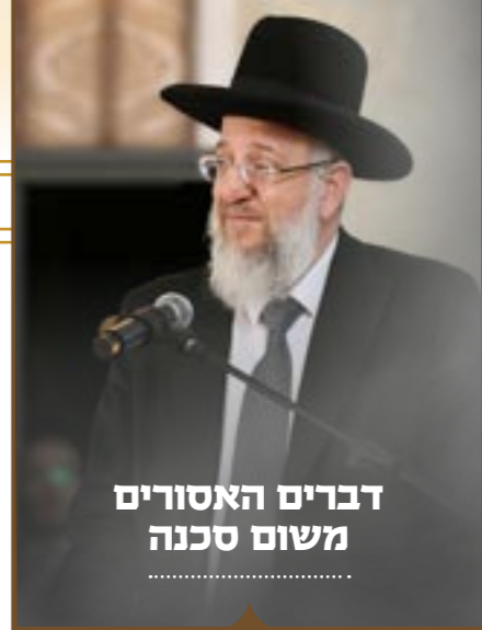
דברים האסורים משום סכנה

אדם שהלך לישון ולא החליף בגדיו, וכשקם מצא שיש לו דבר מאכל בתוך הכיסים, כגון סוכריות וכדומה, האם מותר לאוכלם?