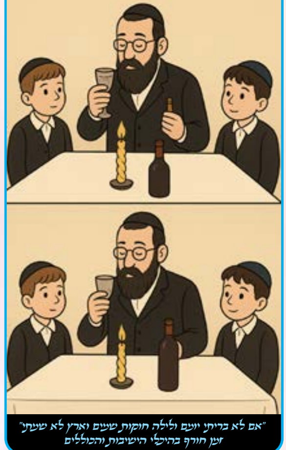
"אם לא בריתי יועם ולילה חוקות שנים וארץ לא שעת" זמן חורף בהיכלי הישיבות והכוללים